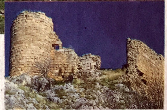
eski kale MÖ 8. yüzyılda yapılan Karatepe Aslantaş Kalesi'dir."

"Bunun için stratejik yerlere düzenli biçimde kaleler inşa edilmiştir. Bugüne kalan 26 kale dolayısıyla Osmaniye 'Kaleler şehri' olarak anılmaktadır. Bu kaleler içerisinde Toprakkale kalesi, Harun Reşit Kalesi, Karatepe Kalesi, Kastabala Kalesi, Hemite ve Çem Kaleleri en önemlileridir. Bunlardan ayakta kalan en